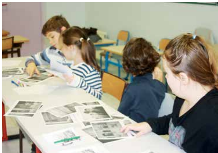
Des ponts entre nous. Cette année, le pays de rencontres est l'Algérie. Les enfants découvrent les photographies de Lola Khalfa, photographe algérienne.