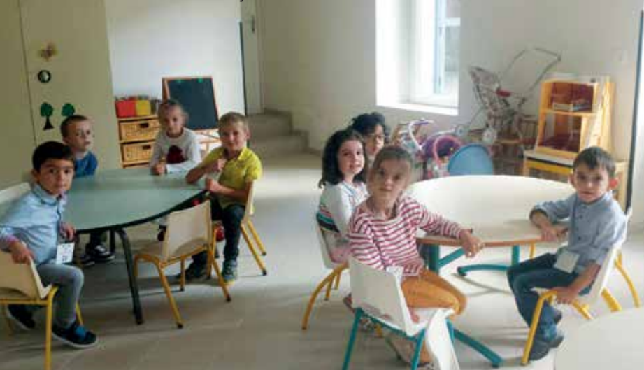
Garderie École maternelle Françoise Dolto

Après une réfection de la toiture il y a une dizaine d'années et récemment, le remplacement des menuiseries, l'enduit ciment grisâtre commençait à se décoller par endroit. L'ensemble a été dépiqueté, les briques nettoyées, un enduit "ton pierre" a été projeté afin d'assurer une étanchéité parfaite, durable et d'un ton proche des constructions voisines.