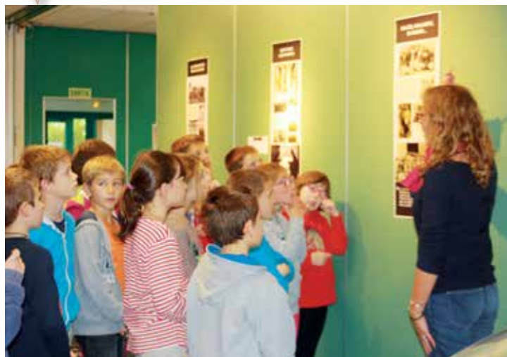
L'exposition « Ces poilus venus d'ailleurs » a eu de nombreux visiteurs.