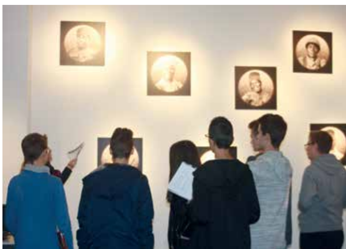
L'exposition « Ces poilus venus d'ailleurs » Les enfants et les collégiens ont appris beaucoup au travers d'un livret-jeu.