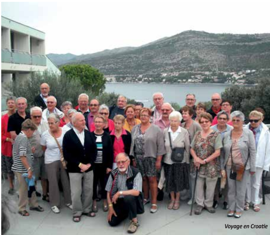
Voyage en Croatie

P endant l'été, notre association fonctionne au ralenti. Nous maintenons les réunions des jeudis, tous les 15 jours mais les marches ont repris le 1 er septembre.