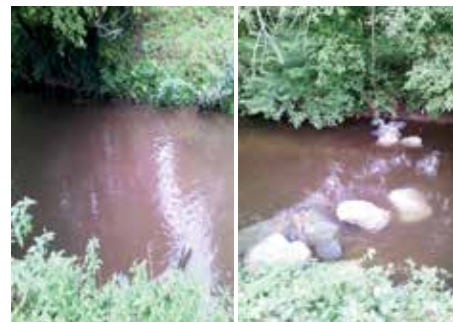
La rivière avant