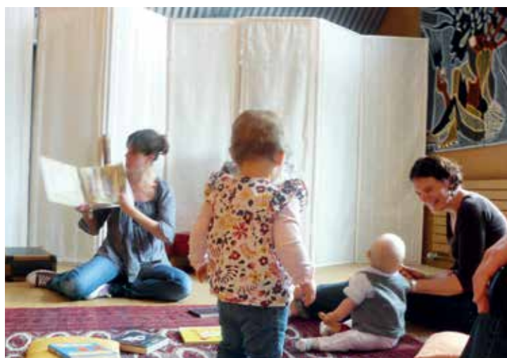
Les moments tendres des séances des Bébés lecteurs.