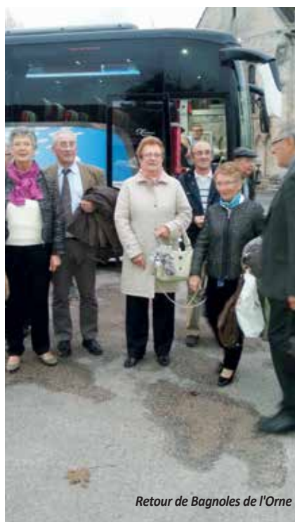
Retour de Bagnoles de l'Orne

Les amis sont des compagnons de voyage qui nous aident à avancer sur le chemin de la vie.