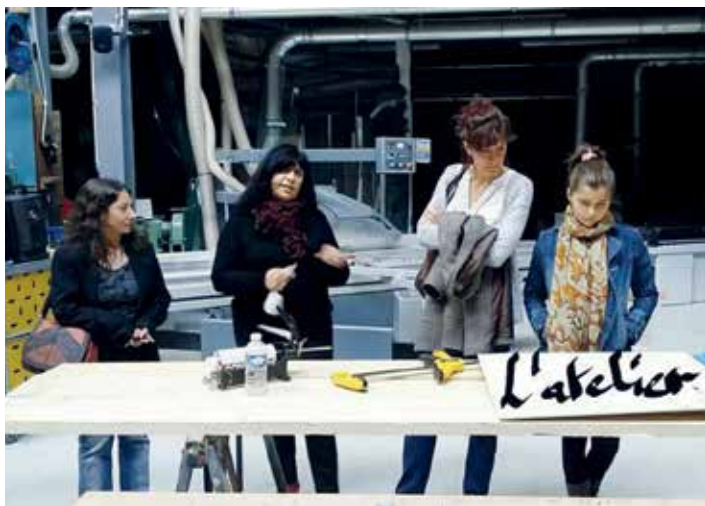
Visite du théâtre d'Hérouville dans le cadre du partenariat avec Verson.